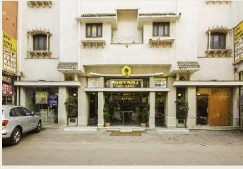
Natraj yes please Delhi

Voici les hôtels ou équivalent dans lesquels nous descendrons :